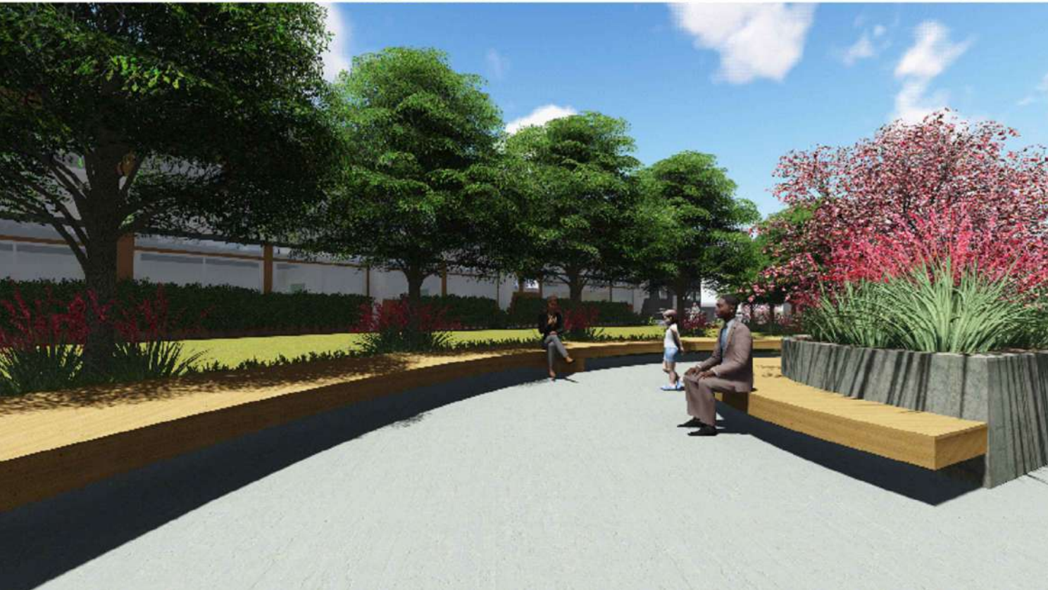
ÁREA DE FUTURA AMPLIAÇÃO